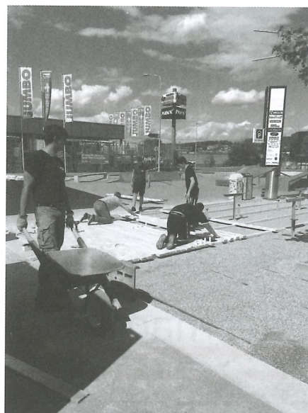
Bodenarbeiten auf dem Jugend- und Begegnungsplatz