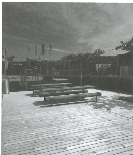
Neuer Boden auf dem Jugend- und Begegnungsplatz

Liebe Grüsse, Stipe und Charlotte Plattform Glattal