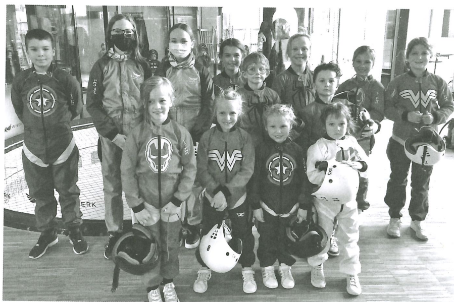
Glückliche Kids nach dem Fliegen.